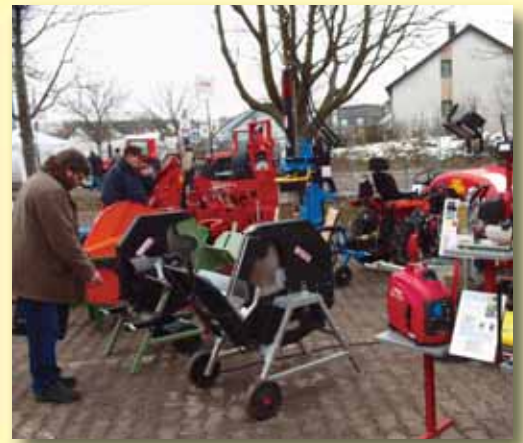
Ausstellung der Firma Freund Landmaschinen, Partenheim