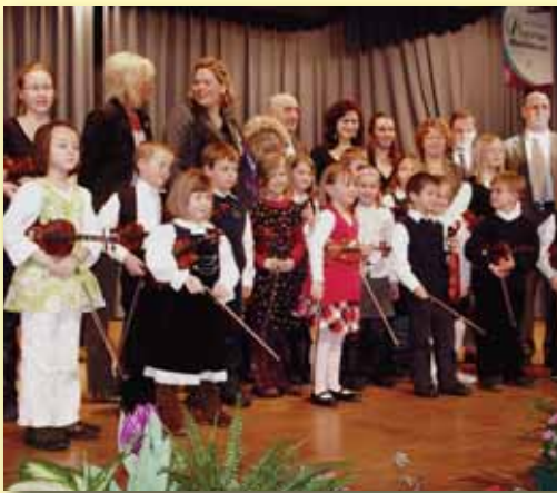
Die kleinen Geigenspieler vom Suzuki-Kurs der Musikschule Ingelheim mit Stadtbürgermeister Dieter Kuhl (rechts)