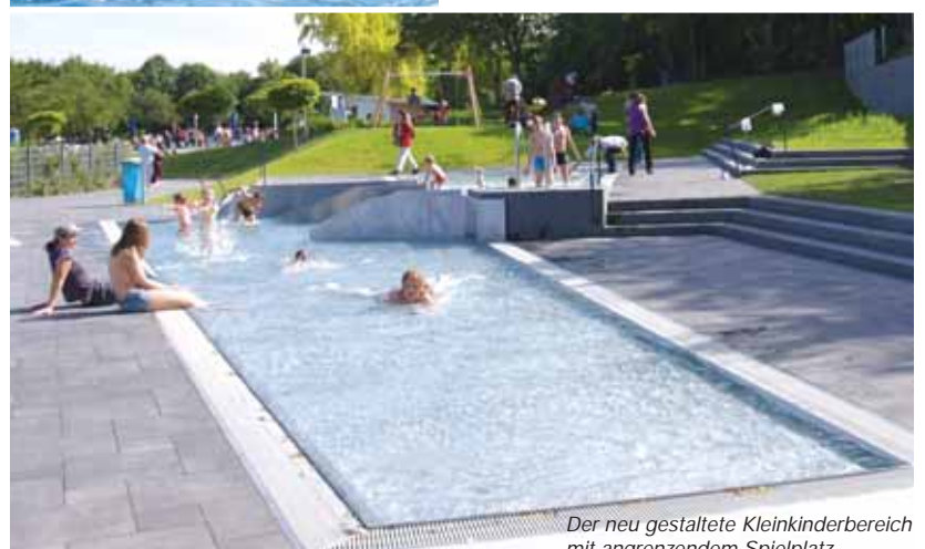
Der neu gestaltete Kleinkinderbereich mit angrenzendem Spielplatz.