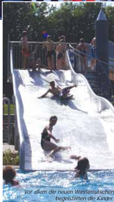
Vor allem die neuen Wasserrutschen begeisterten die Kinder.