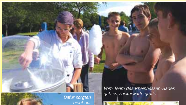
Vom Team des Rheinhessen-Bades gab es Zuckerwatte gratis.