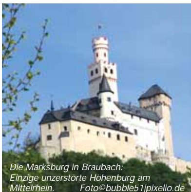
Die Marksburg in Braubach. Einzige unzerstörte Höhenburg am Mittelrhein.

Kartenverkauf ab sofort im Seniorenbüro der Verbandsgemeinde Nieder-Olm bei Frau Braun, Zimmer 224, Tel.: 0 61 36 / 6 91 33 oder den jeweiligen Ortsgemeindeverwaltungen. Anmelde-schluss ist der 16.7.2010 G. F.