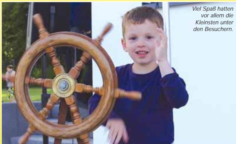
Viel Spaß hatten vor allem die Kleinsten unter den Besuchern.